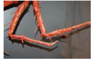
10-4- 4/1 homole crustacé