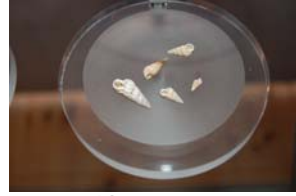
10-1-4/2 scalaire commune mollusque gastéropode