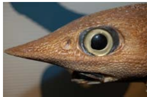
10-4- 3/6 grenadier-scie commun poisson osseux