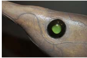
10-4- 1/4 rhinochimère à nez mou chimère