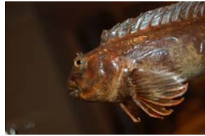
10-2- 3/6 blennie cabot poisson osseux