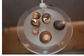
10-1-3/8 bigorneau mollusque gastéropode