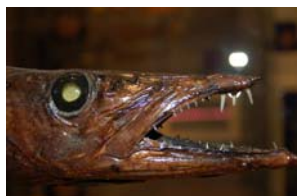
10-5-3/4 escolier à long nez poisson osseux