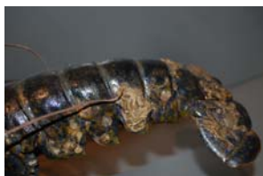
10-3- 1/28 homard bleu crustacé