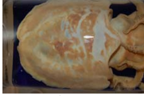
10-1-2/13 seiche commune mollusque céphalopode