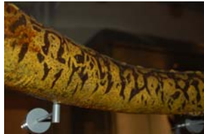
10-2-8/4 murène commune poisson osseux