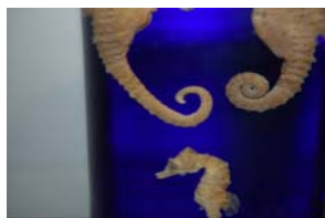
10-3- 5/13 hippocampe à museau court poisson osseux