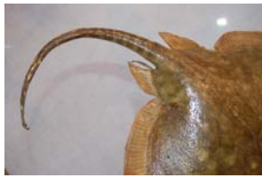
10-1- 2/10 raie bouclée raie