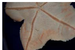
10-3- 4/1 astérie patte d'oie échinoderme