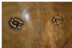
10-3- 5/10 raie fleurie raie