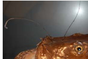
10-4- 3/5 baudroie rousse poisson osseux