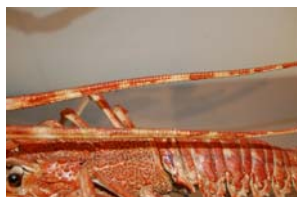
10-3- 3/13 langouste rouge crustacé