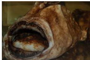
10-4- 3/13 pêcheur bouclé chevelu poisson osseux