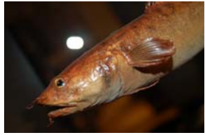
10-2- 3/5 motelle commune poisson osseux