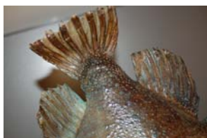
10-3- 5/1 lompe commune poisson osseux