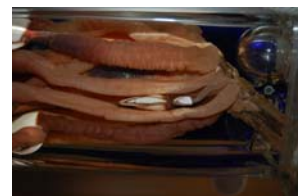
10-5- 1/8 anatifes crustacé