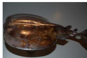
10-3- 5/9 torpille noire raie