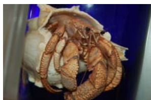
10-3- 1/13 grand bernard l'hermite crustacé