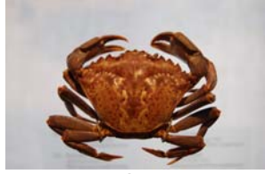
10-1- 2/7 crabe enragé (vert) crustacé