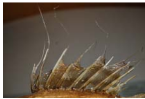
10-3- 5/16 saint-pierre poisson osseux