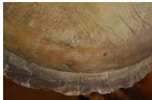
10-5- 1/13 poisson lune commun poisson osseux