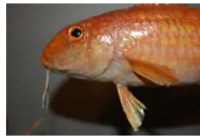
10-3- 5/19 rouget-barbet de roche poisson osseux