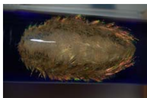
10-3- 2/14 aphrodite ou taupe de mer annélide polychète