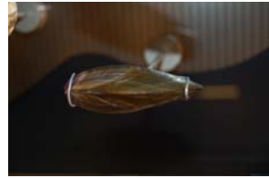
10-2- 4/3 moule commune mollusque bivalve