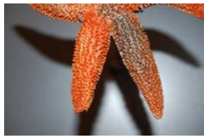
10-3- 1/14 astérie à huître échinoderme