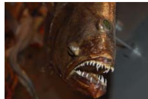
10-4- 3/18 flétan noir poisson osseux