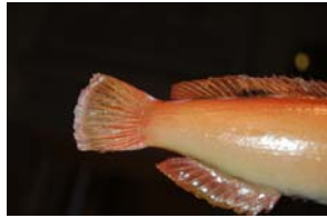
10-2- 8/7 coquette poisson osseux