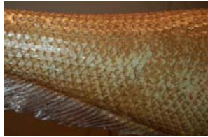
10-4- 3/16 grenadier gris poisson osseux