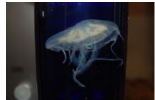
10-5-1/4 vévelle cnidaire méduse