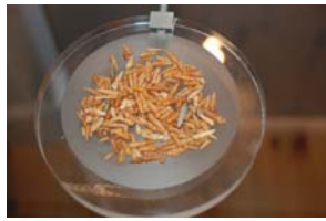
10-1- 3/7 cérithie réticulée mollusque gastéropode