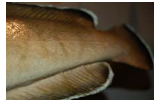
10-4- 3/4 lingue franche poisson osseux