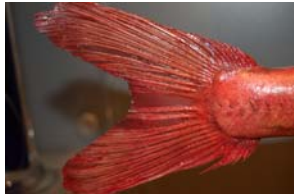
10-4- 3/17 beryx commun poisson osseux