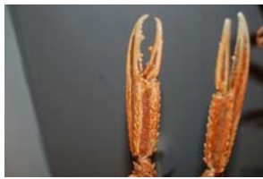
10-3- 2/22 langoustine crustacé