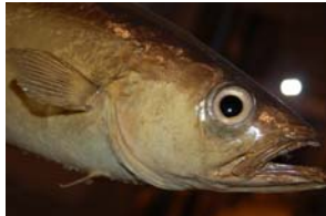
10-2- 8/5 lieu jaune poisson osseux