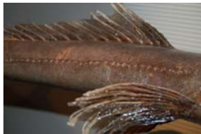
10-4- 3/14 bathysaur gris poisson osseux