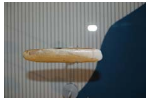
10-1- 1/9 couteau silique mollusque bivalve