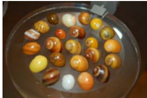
10-2- 4/8 littorine obtuse mollusque gastéropode