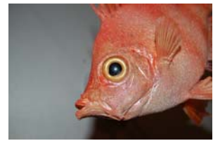
10-3- 5/17 sanglier poisson osseux