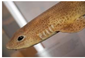
10-1- 2/5 petite roussette requin