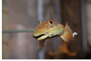
10-1-2/6 callionyme lyre poisson osseux