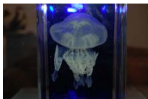
10-5-1/6 rhizostome cnidaire méduse