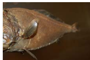
10-5- 2/9 toutendent poisson osseux