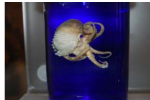
10-5-1/7 argonaute mollusque céphalopode