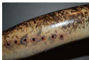
10-3- 5/14 lamproie marine lamproie