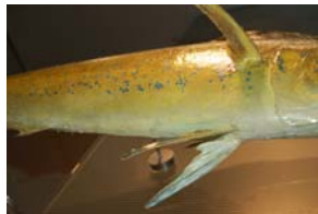
10-5- 1/12 coryphène commune poisson osseux